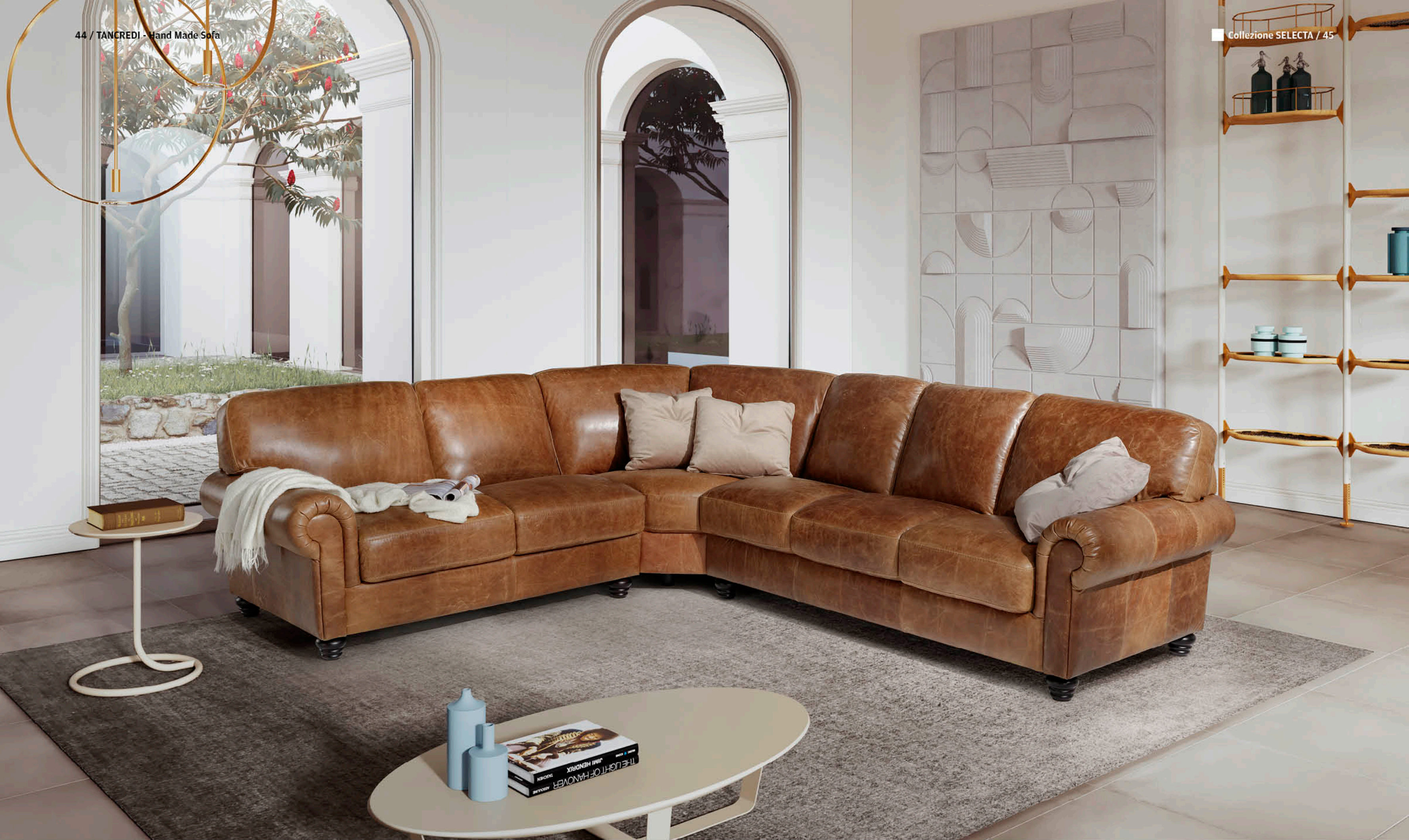
Composizione: 2 Posti 1 Bracciolo sx - Angolo - 3 Posti 1 Bracciolo dx /260x313