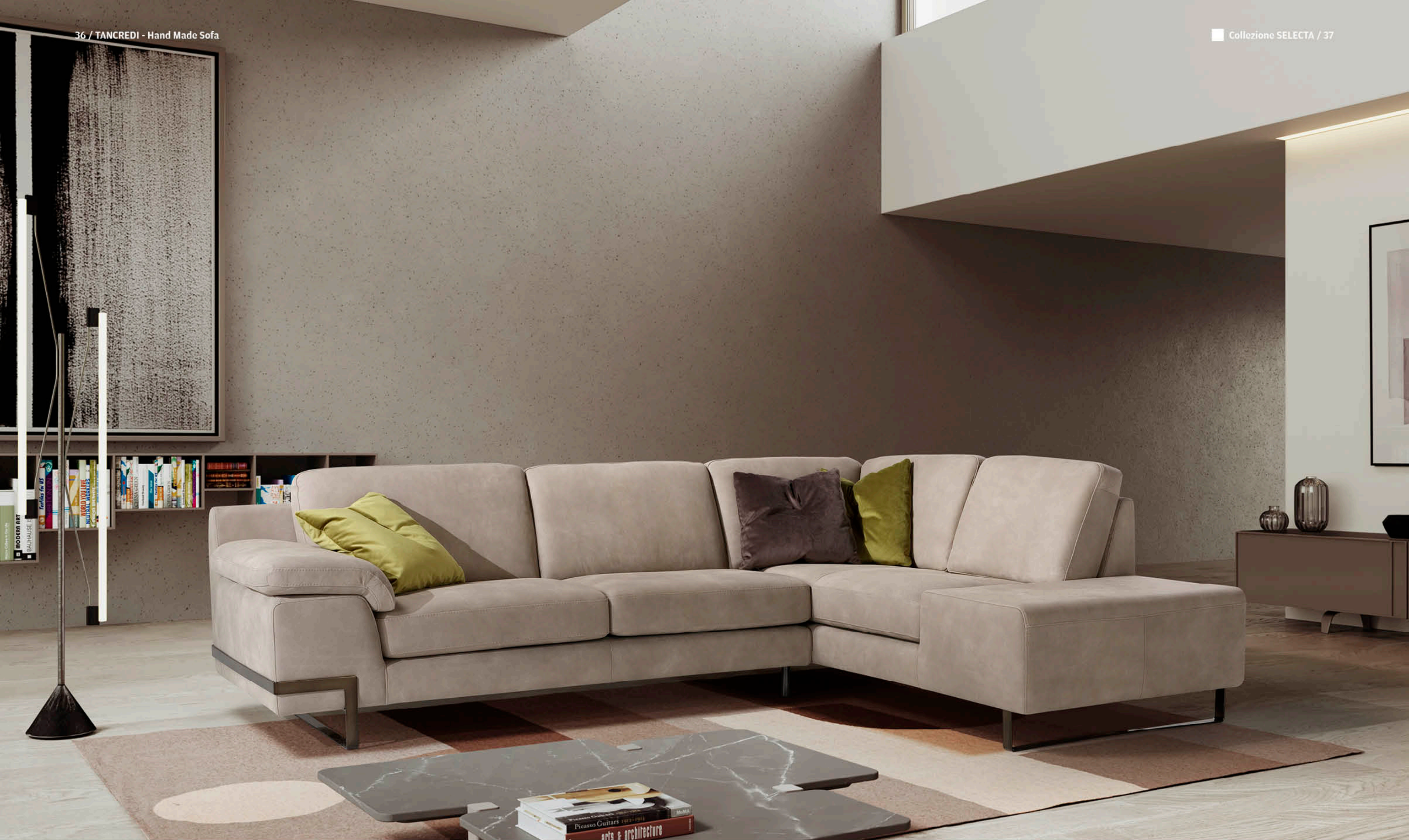
Composizione: 3 Posti 1 Bracciolo sx - Angolo Potrona Terminale dx / 294x214